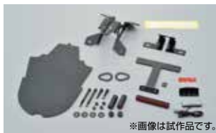
*画像は試作品です。

LEDライセンスランプを採用することで、軽量・スタイリッシュなフェンダーレスキット。専用ステーやリフレクターなど、取付に必要な部品が全て揃ったボルトオンキットです。 ●ブラケット:アルミ製アルマイト仕上げ ●マッドガード:PP製 ●純正ウインカー、テールランプ装着可能 ●平成33年度新基準ナンバー角度に対応