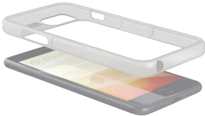
SP ウエザー・カバー